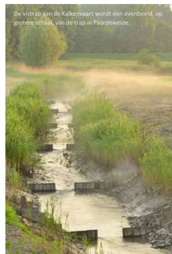
De vistrap aan de Kalkenvaart wordt een evenbeeld, op grotere schaal, van de trap in Paardeweide.