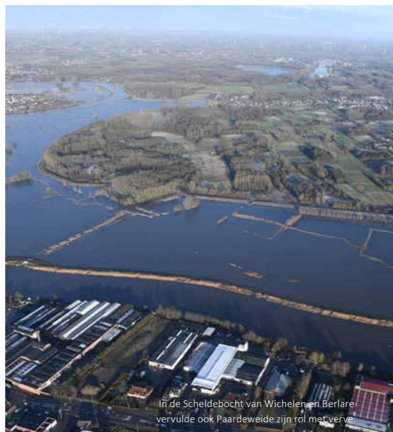
In de Scheldebocht van Wichelen en Berlare vervulde ook Paardeweide zijn rol met verve.