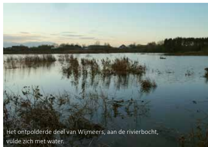
Het ontpolderde deel van Wijmeers, aan de rivierbocht, vulde zich met water.